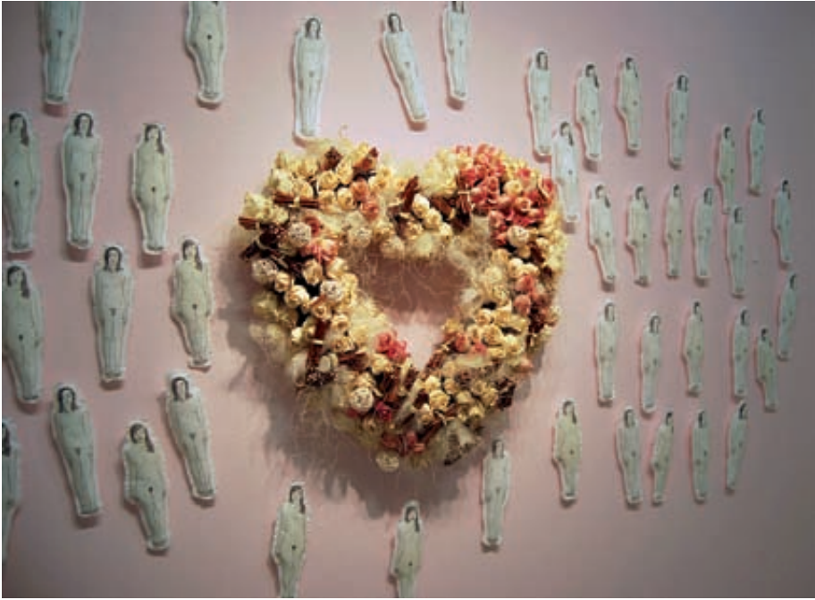
Fig. 9. «las tAradas», Domestica-das, instalación, 2009.