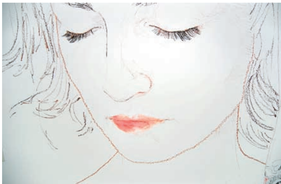
Fig. 8. «las tAradas», Domestica-das, pintura mural con maquillaje, 2009.