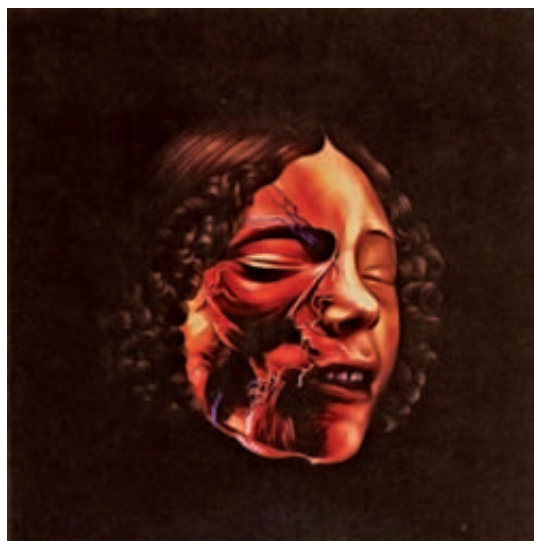
Fig. 3. Marina Núñez, Sin título (Monstruas), óleo sobre lino, 144 x 144 cm, 1996.