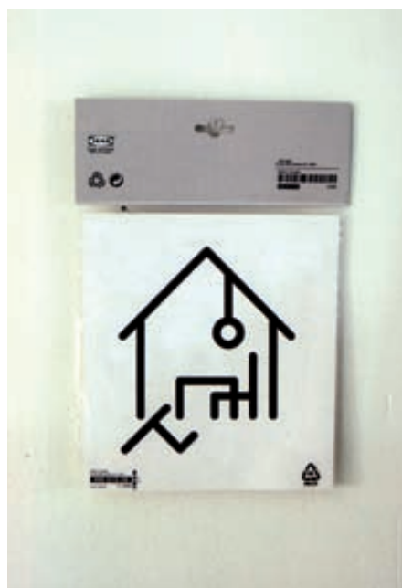
Fig. 6. Diseño de Javier Almalé para Diseñadores gráficos contra la violencia de género, 2006.