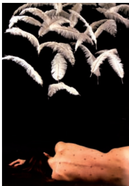
Fig. 5. Soledad Córdoba, Sin título (Ingrávida), serie de 4 fotografías, 126 x 84 cm c. u., 2005.