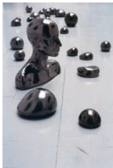
Fig. 4. Mabi Revuelta, Pearls, instalación de cerámica vitrificada, dimensiones variables, 2002.