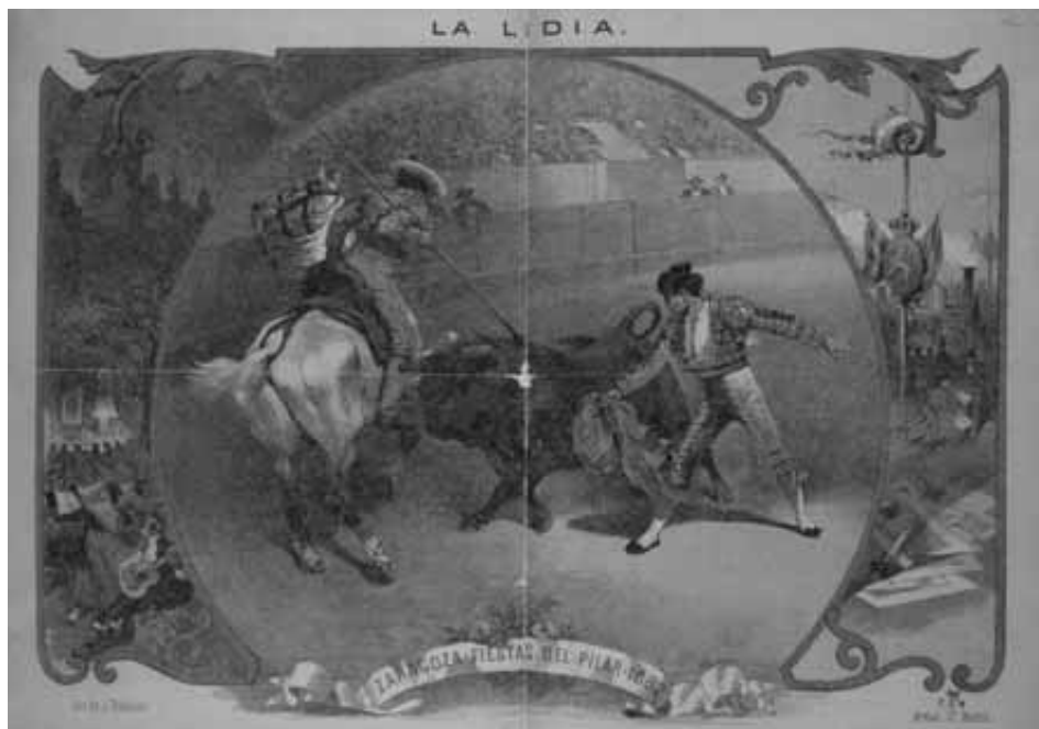
Fig. 10. Cartel para las fiestas del Pilar de 1882 publicado por La Lidia. Madrid. 18 de octubre de 1882, pp. 2-3. (B.N.M.).

únicos matadores de las corridas del Pilar celebradas en este año 55 . La escena lateral izquierda se halla protagonizada por dos elementos simbólicos de la ciudad de Zaragoza: la silueta de la basílica de Nuestra Señora del Pilar y la imagen de esta santa patrona en torno a la cual aparecen unos personajes ataviados con trajes regionales bailando y tocando la guitarra. La escena lateral derecha está presidida por el escudo de la ciudad (león rampante) coronado y flanqueado por banderas, dispuesto sobre un mástil, junto al cual se encuentra un pregonero que distribuye el programa de las fiestas en honor a Nuestra Señora del Pilar. En primer plano se aprecia una serie de carteles y al fondo de la composición se advierte la silueta de una locomotora de vapor, que era el medio en el que llegaban a la ciudad numerosos visitantes atraídos por las fiestas y el transporte usado también para el traslado de las reses hasta las Plazas. Por