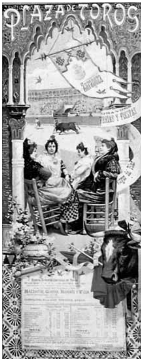
Fig. 14. Cartel para las fiestas del Pilar de 1897.