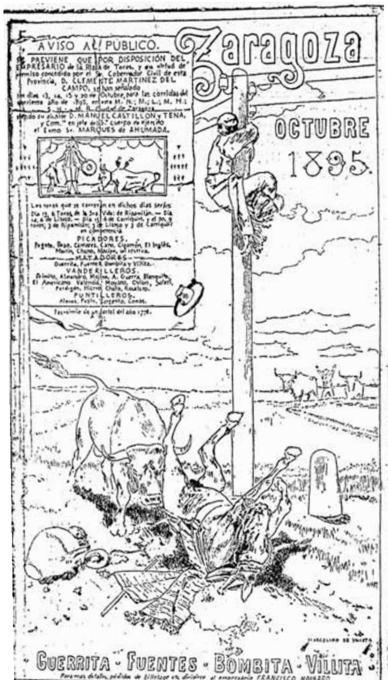
Fig. 13. Reproducción a pluma del cartel para las fiestas del Pilar de 1895 de Marcelino de Unceta, publicada por El Imparcial. Madrid. Lunes, 14 de octubre de 1895, p. 4. (B.N.M.).