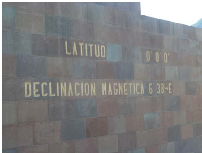
Placa del Monumento a la Mitad del Mundo, Quito, Ecuador.

Situada en el lado occidental de la cordillera de Los Andes y en plena mitad del mundo, a 2800m de altura, se encuentra la capital de Ecuador.