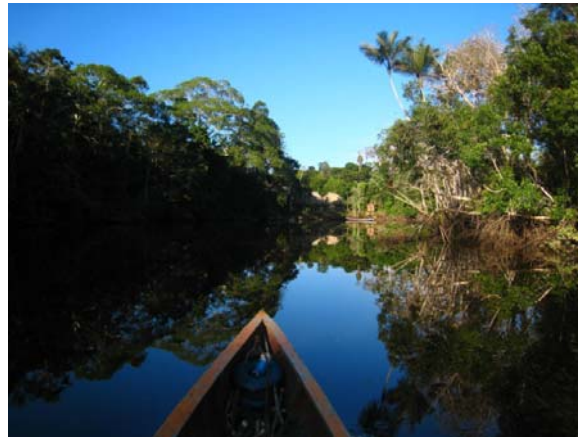
Paseo en Canoa, Cuyabeno, Amazonía ecuatoriana.

vuelta). En playa destaca Montañita, si lo que se desea es fiesta estilo latino y surf (la playa se encuentra entre las 15 mejores a nivel internacional para este deporte), no ha de sorprender la abundancia de argentinos surfers en el lugar (como maños en Salou). Si se desea algo más tranquilo, hay otras playas en Esmeraldas y Manabí, o ya por la zona de Guayaquil.