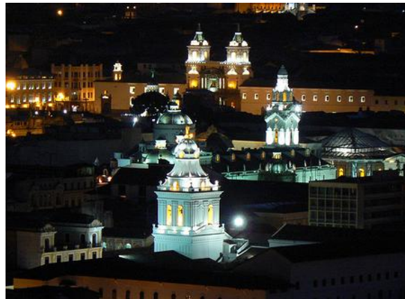
Vista nocturna del Centro Histórico de Quito, Patrimonio Cultural de la Humanidad.

San Agustín , entre otras. Iglesias que manifiestan el barroco quiteño, uno de los máximos representantes del barroco latinoamericano.