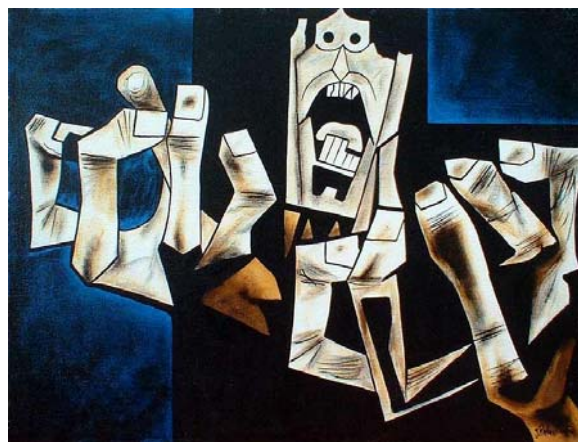
El grito (de los pueblos), Oswaldo Guayasamín.

Además de las manifestaciones del pasado quiteño, destacan las contemporáneas. En este sentido cabe señalar, la Fundación Guayasamín y la Capilla del Hombre, dedicadas a las colecciones y obra del artista pictórico ecuatoriano Oswaldo Guayasamín. Pero también cabe mencionar el Centro de Arte Contemporáneo, que alberga exposiciones y talleres gratuitos.