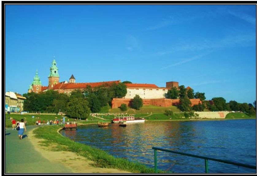
El castillo del Wawel y el río Vístula