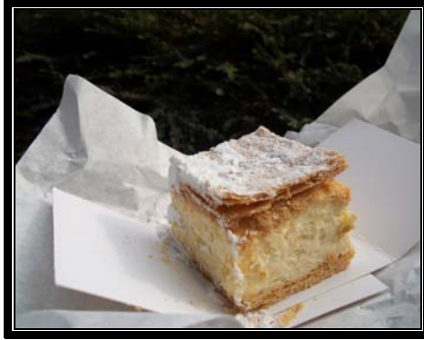
Kremowka (Dulce típico de Cracovia)