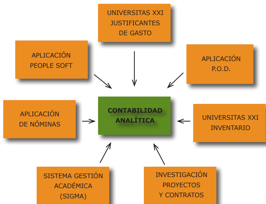
FIGURA A.1. FUENTES DE INFORMACIÓN

La Contabilidad Analítica necesita obtener los datos que va a tratar de los principales sistemas de información de la Universidad de Zaragoza: Universitas XXI, Sigma, People Soft, Aplicación de Nómina y Aplicación de Investigación.