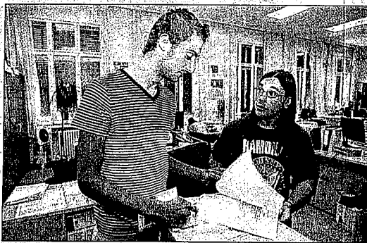
► Un alumno se matricula en Periodismo.