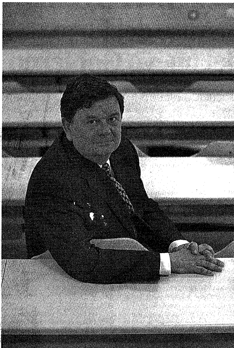
López es el candidato de los grupos Renovación y Colectivo. ESTHER CASAS

los docentes servirán también para el PAS. Contemplaremos la carrera profesional y las jubilaciones anticipadas. Trabajaremos en un plan de mejora de toda la gestión. Si gana, le tocará lidiar con la DGA. ¿Qué le pide en materia de financiación?