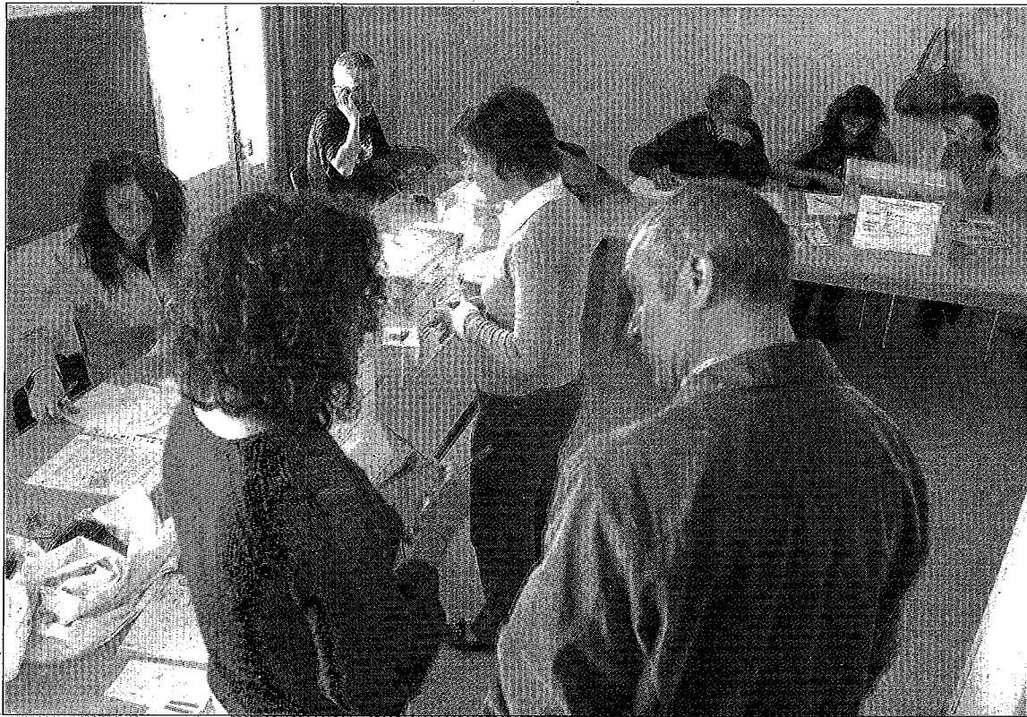
Imagen de las votaciones de ayer en los centros de Huesca. VÍCTOR IBÁÑEZ -