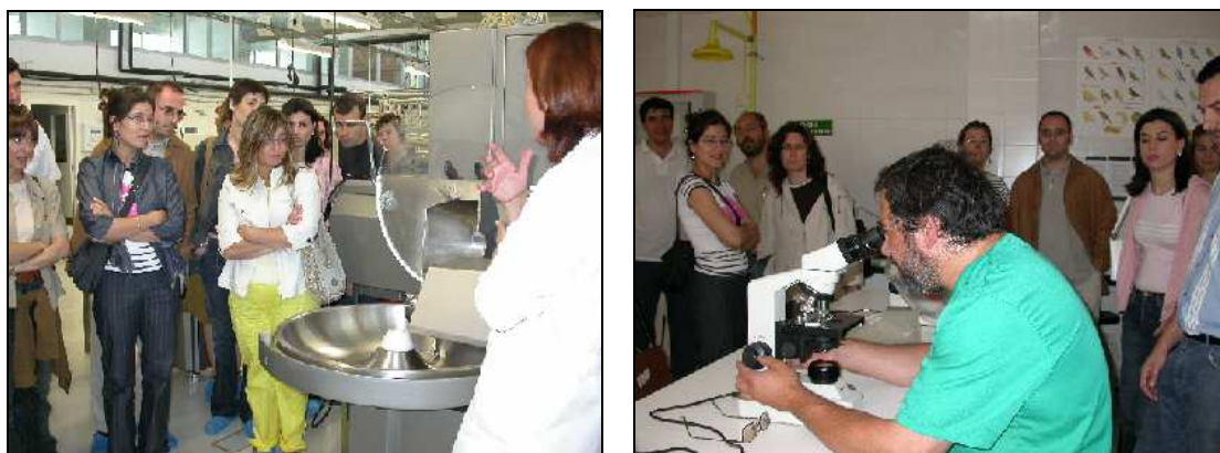
Figura 2. Imágenes de la visita a la Facultad de Veterinaria

Una primera conclusión de estas experiencias fue la constatación del profundo desconocimiento mutuo sobre la actividad no sólo de los docentes en diferentes centros de enseñanza sino en general de las actividades o competencias propias de cada titulación, si quiera a título demostrativo.