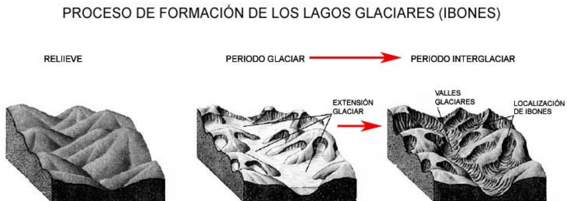
Figura 1. Proceso de formación de los lagos glaciares.