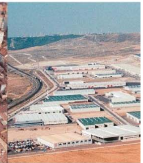
■ URBANIZACIÓN POLÍGONO INDUSTRIAL CENTROVIA EN LA MUELA (ZARAGOZA)