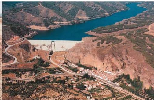
■ PRESA DEL VAL LOS FAYOS (ZARAGOZA)