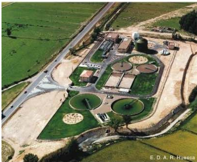
■ ESTACIÓN DEPURADORA DE AGUAS RESIDUALES DE HUESCA