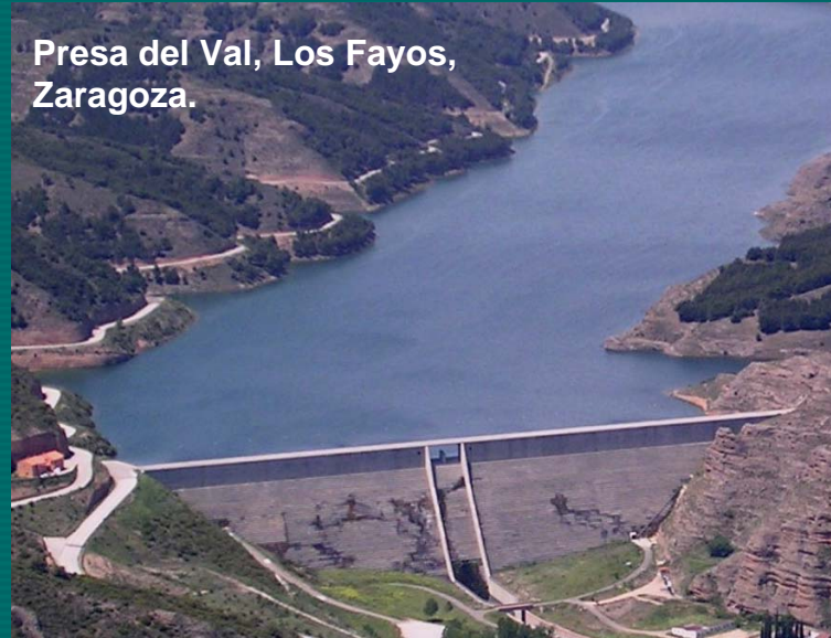
Presa del Val, Los Fayos, Zaragoza.