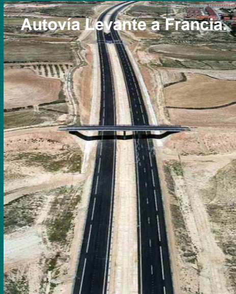
Autovía Levante a Francia.