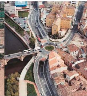
■ PASO INFERIOR DE CALLES LOGROÑO (LA RIOJA)