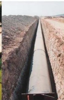
■ ABASTECIMIENTO DE AGUA A ZARAGOZA. TRAMO SORA-LA LOTETA.