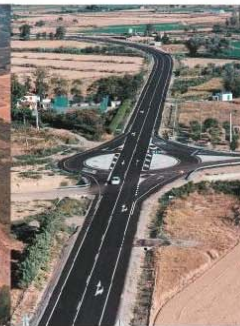
■ CARRETERA A-131 FRAGA-HUESCA