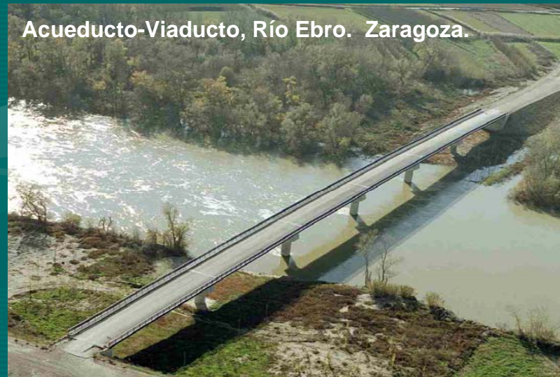
Acueducto-Viaducto, Río Ebro. Zaragoza.