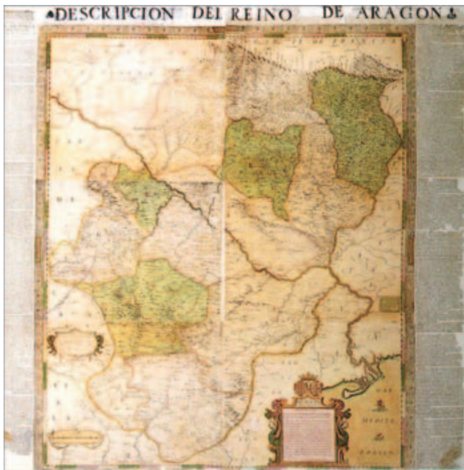
Fig. 1. Mapa de Aragón, João Baptista Lavanha, Descripción del Reino de Aragón (1620 y 1622).

tes de los problemas del anacronismo y por lo tanto de las diferentes «geografías» existentes en el pasado. Y ante ello, debíamos estar atentos los historiadores del arte y la arquitectura pues, al menos desde La Méditerranée (1949) de Fernand Braudel (1902-1985), se ha señalado la relevancia de contar con las condiciones de existencia —físicas y humanas, geográficas— de los objetos de nuestro estudio, y éstas eran también históricas. 7