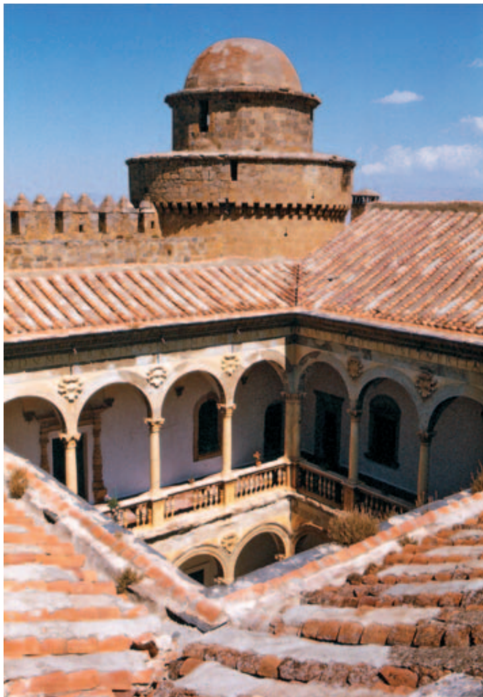
Fig. 4. La Calahorra (Granada), Castillo del Marqués del Zenete, patio.