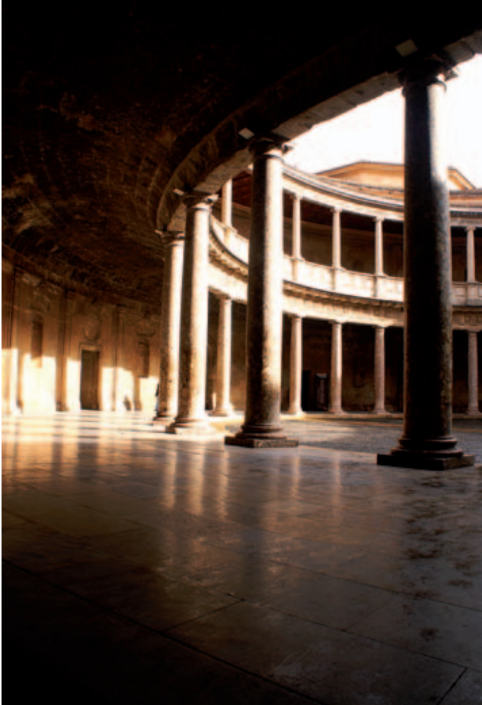
Fig. 3. Alhambra, Granada, Palacio de Carlos V.