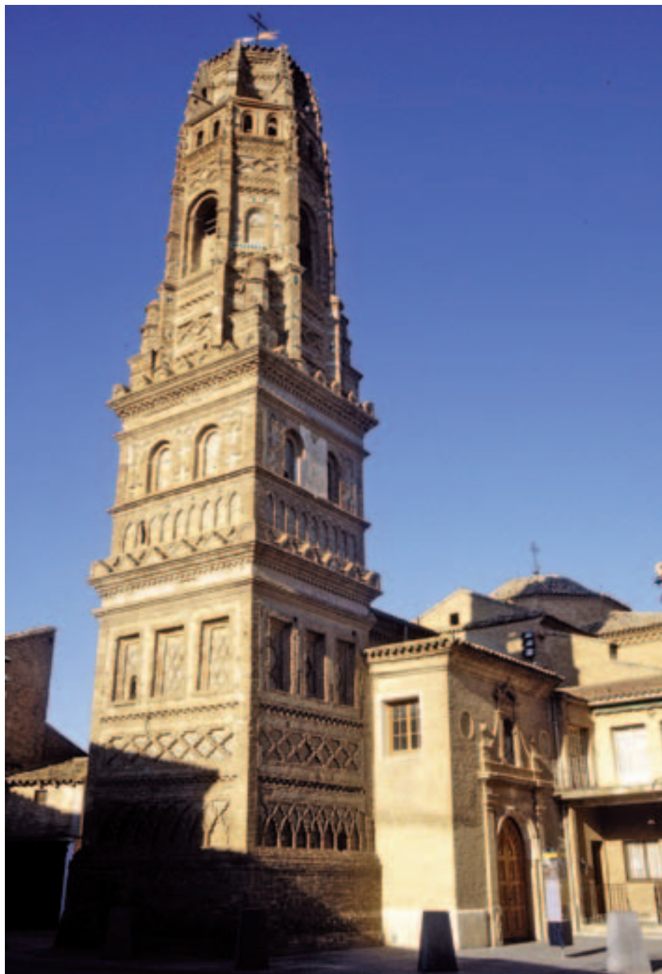
Fig. 5. Santa María de Utebo, Torre.