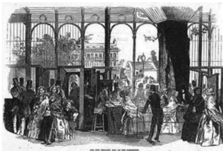
Fig. 7. Vista de la entrada de la Exposición el quinto día que la entrada costaba un chelín.