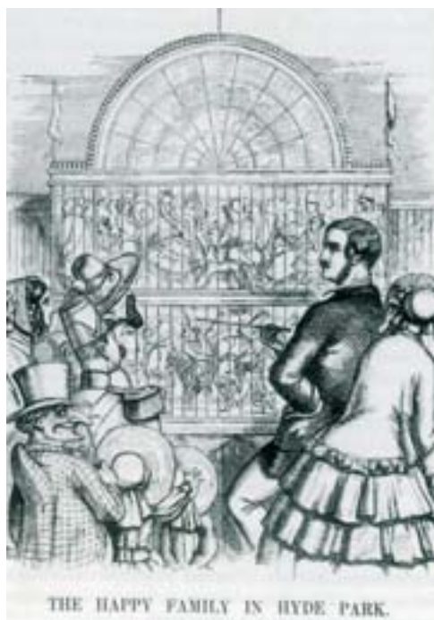
Fig. 14. John Tenniel. «The happy family in Hyde Park». Punch . 19 Julio 1851.

El estereotipo permitía consolidar una «imagen europea», la mirada colonial occidental, que el siglo XX no haría otra cosa que moldear y sofisticar.