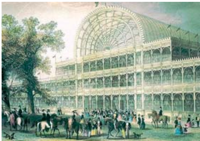
Fig. 3. Vista del transepto norte Crystal Palace.