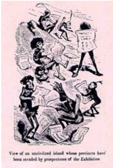
Fig. 12. Gustav Doré. Vista de una isla salvaje con la publicidad de la Gran Exposición.

espectáculo para que aumentase la cantidad de espectadores, pertenecientes ya a todas las clases sociales. Y, de este modo, el ocio se convierte en un negocio, antes que en un arte. Hasta entonces ese negocio había sido patrimonio exclusivo de las clases superiores, que lo habían convertido en un espacio de lujo. Con la incorporación de las clases bajas al conocimiento de la ciencia, del arte, del ocio se completa el último eslabón hacia el nuevo capitalismo, el liberalismo económico, que distancia aún más la relación ente valor y precio. En la Gran Exposición se reúne el muestrario del nuevo mundo, se expone la materia con la que se construirá el negocio de la cultura, del ocio, de la ciencia y del negocio del siglo XIX y, sobre todo, del XX, mediante la captación de nuevos clientes, que pertenecen a las clases bajas, incorporadas como público y jueces de valor devaluados. La exposición no hizo más que reflejar y remarcar las diferencias sociales de la sociedad victoriana.