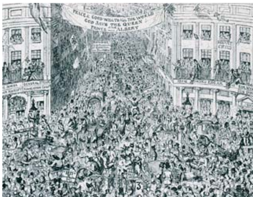
Figs. 8 y 9. George Cruikshank. Manchester 1851. London 1851.