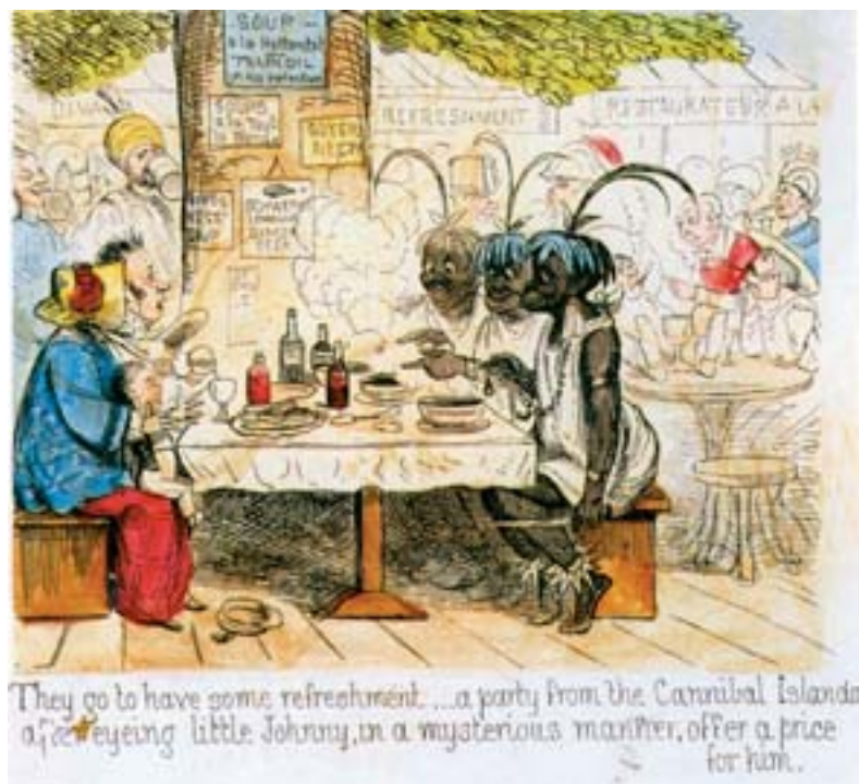
Fig. 15. Thomas Onwhyn's. «Isleños caníbales». Mr. And Mrs. Brown's Visit to London to see the Great Exhibition of All Nations. 1851.

como aperitivo (fig. 15). En estas viñetas se justifica la eficacia de las exposiciones universales en la contundente maniobra colonial que los países europeos organizaron durante el siglo XIX. En su esencia de gran cuadro viviente organizado para la mirada occidental, las exposiciones universales terminan por ser uno de los escenarios más eficaces en la puesta en escena de las diferencias culturales. El triunfo de estos estereotipos se consagra en las exposiciones coloniales, donde se mira a pueblos más atrasados tecnológicamente de una manera sesgada, no exenta de una cierta depravación por la simplicidad a la que se les reduce 19 .