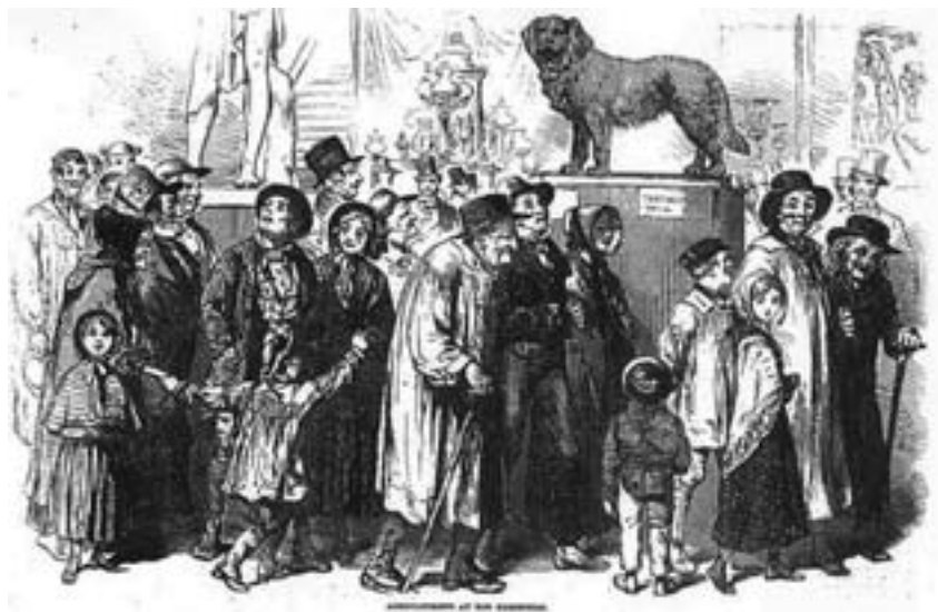
Fig. 5. Agricultores en la Gran Exposición. Illustrated London News. 19 julio 1851.

siones, por la nada agradable tarea educativa, pasó a considerarse una actividad de entretenimiento, asociada al placer, surgiendo el nuevo concepto de ocio moderno 10 . La Gran Exposición inauguró el fenómeno del turismo moderno, transformando la excursión de un episodio anecdótico, en un elemento cotidiano de la vida en la era victoriana. La revolución de los transportes permite que, primero, burgueses y, después, las clases más humildes, puedan imitar el comportamiento de la nobleza en sus desplazamientos al abaratare los costes del viajar, en una actividad de ocio y de recreo nuevas, devaluando la idea que muchos conservaban del viaje cultural.