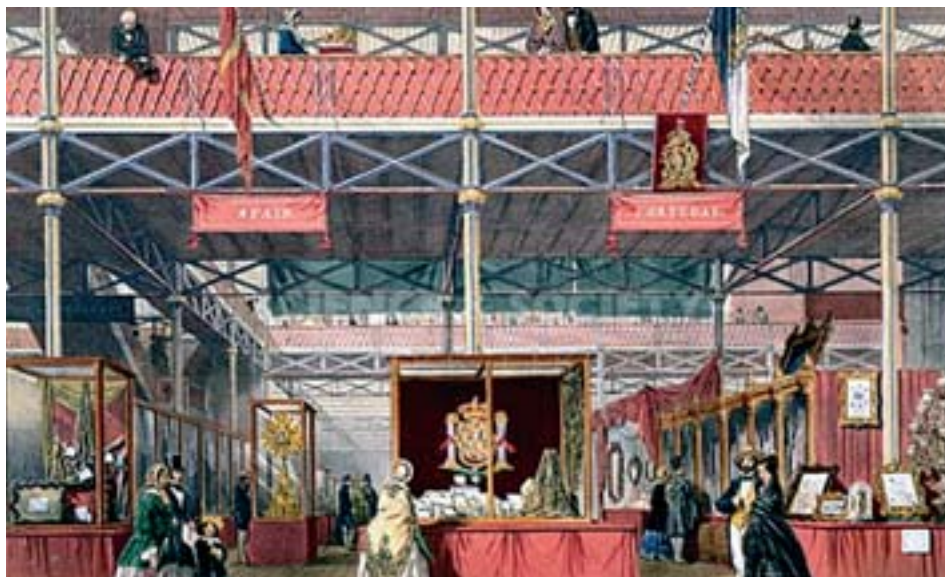
Fig. 2. Vista de la sección dedicada a España y Portugal en el Crystal Palace.

con la luna, merced a la fe depositada en la nueva religión: la Razón y el Progreso. En este contexto, la ruptura de las distancias se presenta como el principal testimonio del progreso de la industria humana.