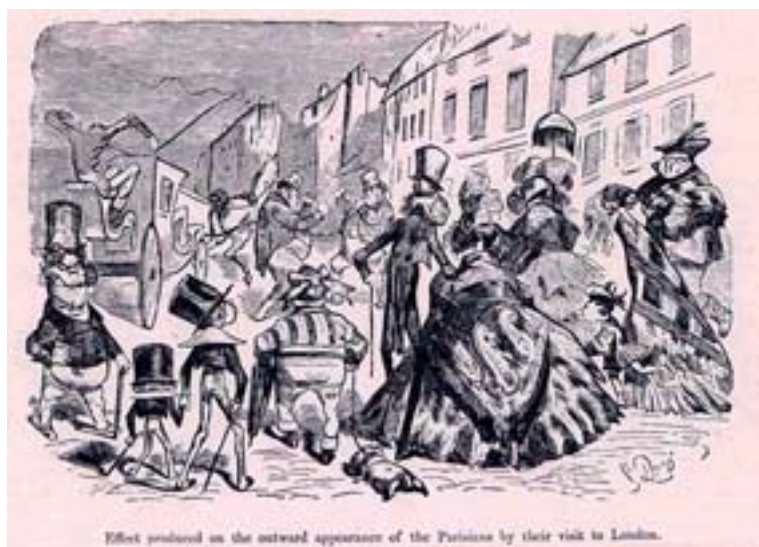
Fig. 6. Gustav Doré. Los parisinos visitan Londres.