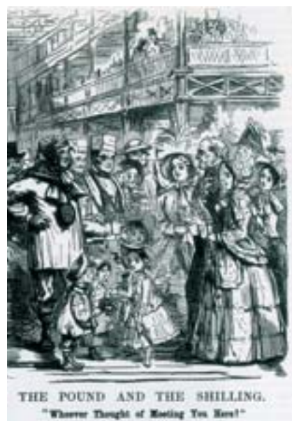
Fig. 11. «Las clases y las masas». Punch. 14 Junio 1851.

elevación de las clases trabajadoras de su lamentable incultura, ignorancia y moral degradada — 12 (fig. 11).