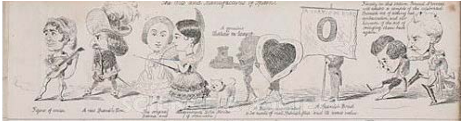
Fig. 1. Caricatura de la presencia española en la Gran Exposición de Londres. 1851.

la Gran Exposición fue discreto. La presencia en el Crystal Palace, al lado de Cerdeña, había quedado reducida a una selección de artesanía y objetos históricos, que incluía elementos tan dispares como armaduras, manufacturas religiosas o cerámicas. En uno de los muchos libros cómicos que sobre el evento se hicieron, España aparece representada por un majo, un don Juan, una bolera, a la que siguen otros histriones de idéntico porte. Estereotipo semejante al que consagra Juliette de Robersart doce años más tarde al escribir que, una vez cruzada la frontera: España apareció ante mí como un soldado con una guitarra colgada del cuello 1 . Esta imagen visionaria del país descansaba precisamente en la sustitución del arma por la guitarra, que se convertirá en el arma del espectáculo moderno, en el instrumento de la economía moderna, del negocio de la cultura y del turismo, para un país al margen de los grandes acuerdos coloniales. No es casual tampoco que compartiese el espacio de la viñeta con Rusia, otro país fronterizo para la Europa del XIX. Los confines del continente, Oriente y Occidente, se estereotipaban en una imagen folklórica y pintoresca, que poco tenía que ver con las sociedades industrializadas que se dieron cita aquel año en Londres (figs. 1 y 2).