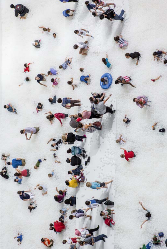
Sharkitecture-The-Beach-(instalación)-National-Building-Museum-Washington-DC-2015-1-1 - publicdelivery.org