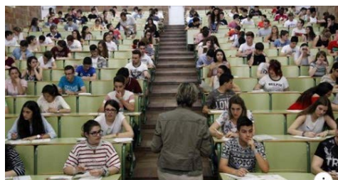
ELPERIODICODEARAGON.COM Casi 800 alumnos se presentan el martes a Selectividad La prueba empezará con el ejercicio de Historia de España