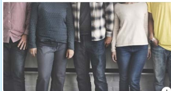
UNIZAR.ES Actualidad | Universidad de Zaragoza Las sesiones, que incluyen información sobre exámenes, prácticas,...