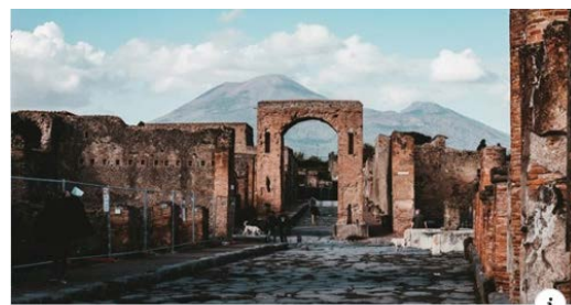
READINGTHECITY.COM Reading the City Travel by book. Find a new perspective. Discover book recommendations ...