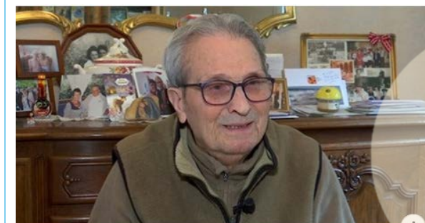
RTVE.ES Documaster - Joan Tarragó: El bibliotecario de Mauthausen - RTVE.es