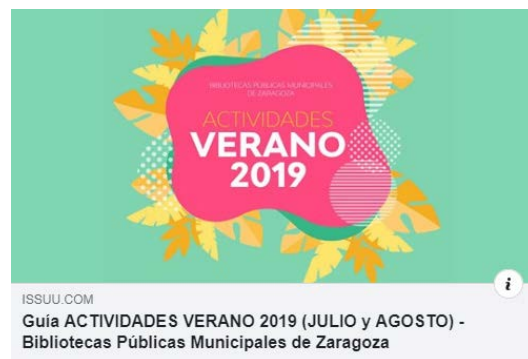
ISSUU.COM Guía ACTIVIDADES VERANO 2019 (JULIO y AGOSTO) - Bibliotecas Públicas Municipales de Zaragoza