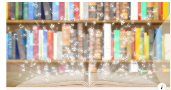
MUYINTERESANTE.ES Test: Adivina el libro ¿Te consideras un ávido lector? Te ponemos a prueba con estos clásicos ...