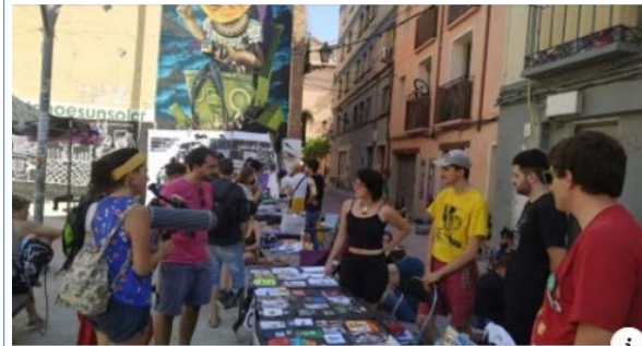
UNIZAR.ES Actualidad | Universidad de Zaragoza La visita gratuita, que comenzará a las 19h y no precisa inscripción, forma...