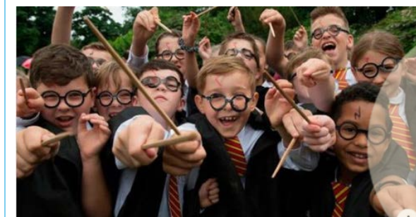
CULTURAINQUIETA.COM Científicos de varias universidades dicen que los fans de Harry Potter son mejores personas - Cultura Inquieta