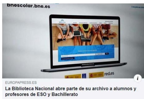
EUROPAPRESS.ES La Biblioteca Nacional abre parte de su archivo a alumnos y profesores de ESO y Bachillerato