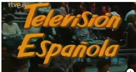
RTVE.ES Llega un nuevo canal en YouTube de Archivo RTVE