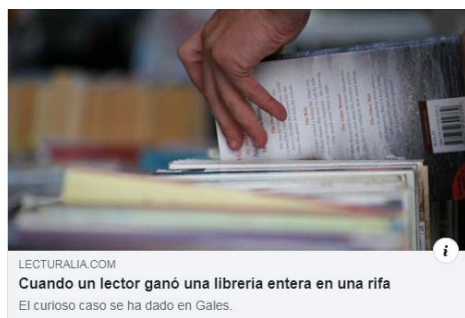
LECTURALIA.COM Cuando un lector ganó una librería entera en una rifa El curioso caso se ha dado en Gales.