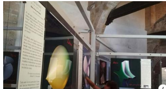
HERALDO.ES El primer museo matemático de Aragón se estrena el sábado