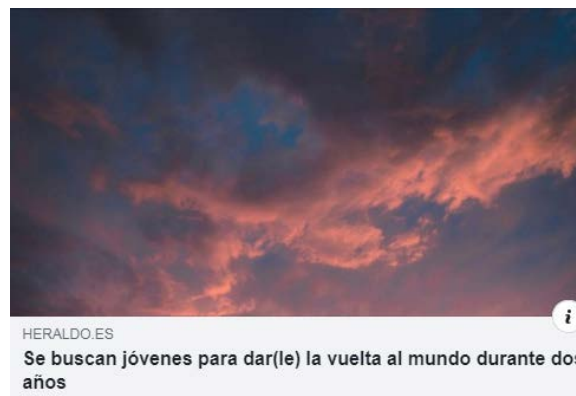
HERALDO.ES Se buscan jóvenes para dar(le) la vuelta al mundo durante dos años