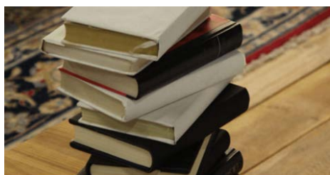
QUELEERLIBROS.COM La primera frase de un libro puede enamorar inmediatamente - QuéLeer