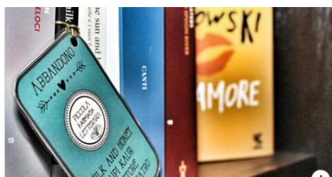
CERODOSBE.COM Libros como medicina: abre la primera 'farmacia' literaria Una nueva librería en Florencia ofrece soluciones literarias a cualquier...