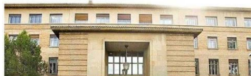
ALBARRACIN.UNIZAR.ES Catálogo Archivo Central. Universidad de Zaragoza Expedientes académicos

fondo antiguo de la Facultad de Filosofía y Letras de 1850-1968