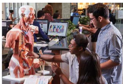
Horizon Report - 2017 Library Edition

30/11/2017 Informe Horizon edición bibliotecas 2017 sobre las tendencias en bibliotecas universitarias