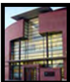
Vicerrectorado del campus de Teruel, Universidad de Zaragoza

La sede turolense de la Universidad no se queda atrás en cuanto a deporte. El Torneo Social ya está en marcha y aunque solo cuenta con la categoría de Fútbol Sala Masculino, la participación de los